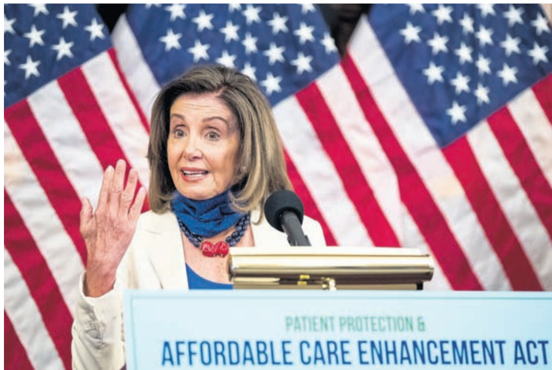
House Speaker Nancy Pelosi of Calif., speaks during news conference unveiling the Patient Protection and Affordable Care Enhancement Act on Capitol Hill in Washington on Wednesday, June 24, 2020.

COVID-19 cases are rising in major states like Texas, Florida and California, and millions of workers who have lost coverage in the economic shutdown to contain